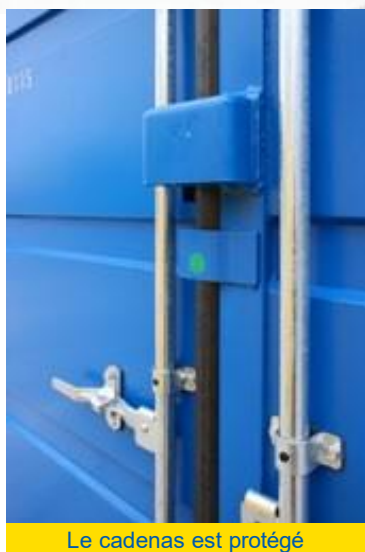
Le cadenas est protégé