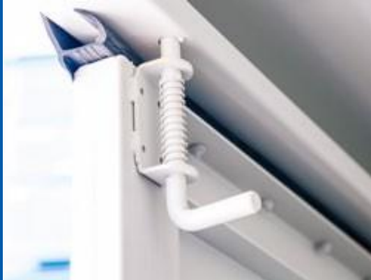
2 verrouillages internes