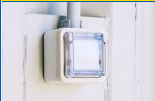
Tableau électrique avec prises intégrées