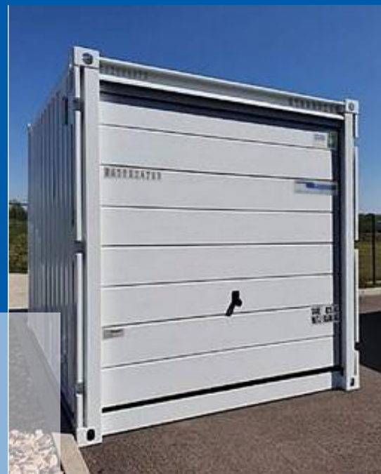
Porte de garage sectionnelle pratique