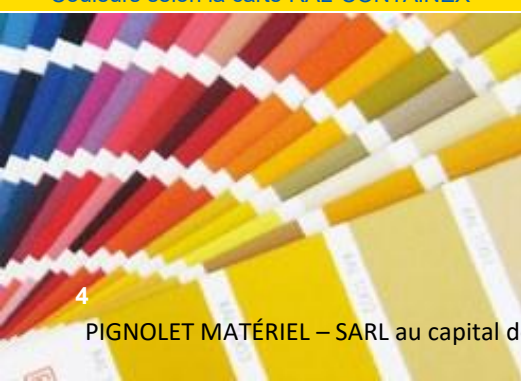
Couleurs selon la carte RAL-CONTAINEX