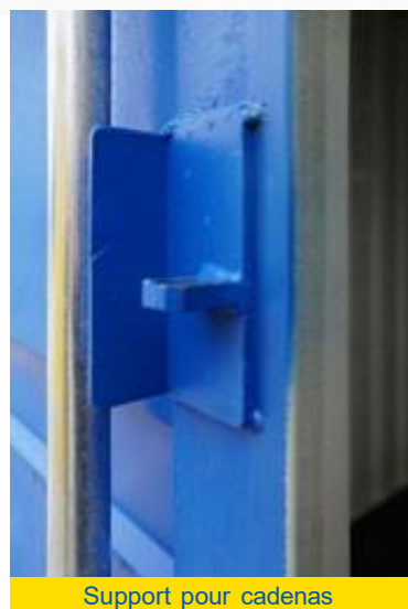
Support pour cadenas