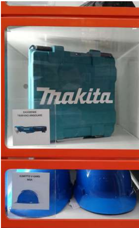
Option rangement double/triple hauteur pour objets volumineux