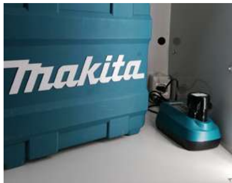
Prise interne pour recharger le matériel (en option).