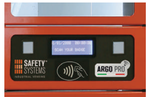
Boutons pour sélectionner la fonction Prélèvement/Retour