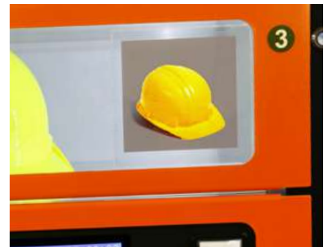
Pochette avec image personnalisable du produit contenu dans le rangement.